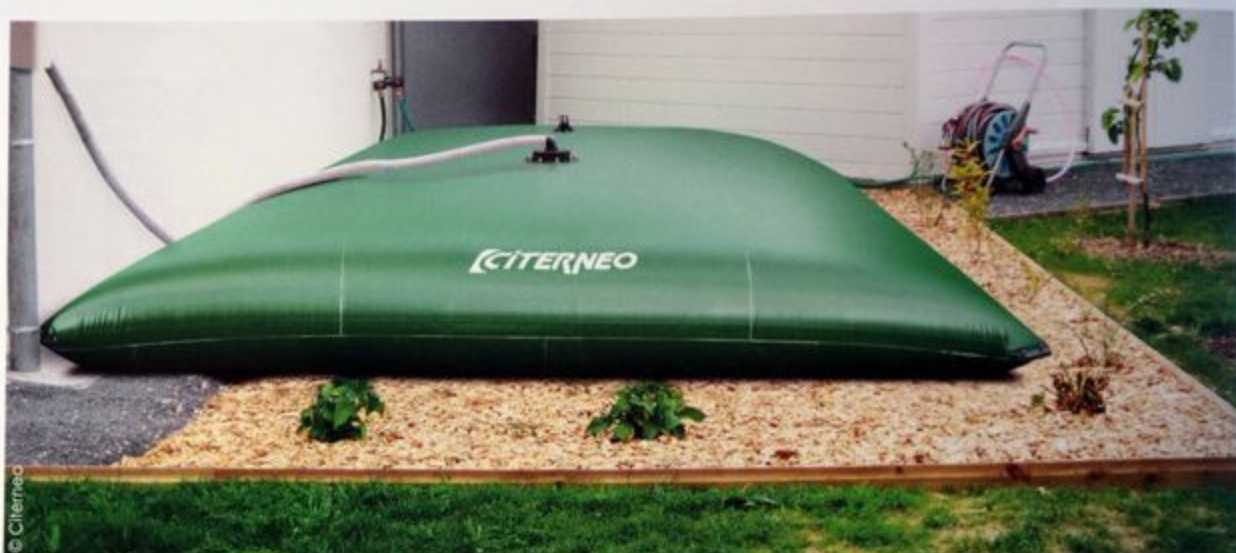
Solutions économiques pour récupérer les eaux de pluie, sans engager des travaux : les citernes souples. Elles s'installent partout et rapidement. Capacité de stockage maximale : 2 000 m 3 . Prix : environ 6 000 € TTC pour 300 m 3 .

Vos clients sont de plus en plus nombreux à vous solliciter pour installer des cuves aériennes et/ou enterrées afin de disposer d'une réserve d'eau suffisante pour arroser leurs jardins en période de sécheresse. Voici comment et avec quoi.